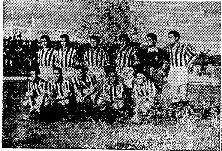
Los tres datos gráficos históricos del primer partido en el Estadio: la salida del Aviación y el Castellón, los primeros equipos de Primera División que cruzaron el túnel subterráneo; el once del titular que actuó en esta gran jornada; y el primer resultado, victorioso para los locales, que señaló el marcador del nuevo Estadio.