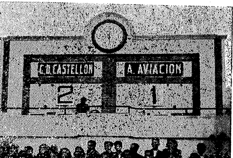
El once del titular que actuó en esta gran jornada; y el primer resultado, victorioso para los locales, que señaló el marcador del nuevo Estadio. — (Fotos WAMBA).