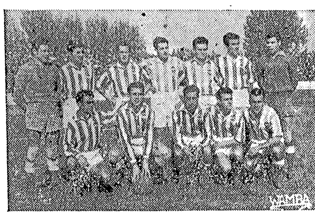
HACE SIETE AÑOS EL CASTELLÓN VIVIA TAMBIÉN LA ALEGRIA DE SU ASCENSO A SEGUNDA DIVISION: HE AQUI EL EQUIPO QUE LO LOGRO EN TONCES.

V UELVE el Castellón a Segunda División y se impone reparar rápidamente ante el lector los ascensos anteriores, el historial de nuestro Club en la Liga a través de ascensos y descensos que lo llevaron por unos años y lo han tenido en dos ocasiones a punto de desaparecer incluso de la categoría nacional. Esperamos que esta sea la última vez que tengamos que acudir al Castellón en su paso de Tercera a Segunda, porque aquella categoría ya es lo suficientemente conocida como para realizar todos los esfuerzos necesarios para evitarla, como se ha podido evitar tantas veces con un poco de aplicación al esfuerzo por no descender. Pero vayamos a esta breve historia del Castellón en Segunda.